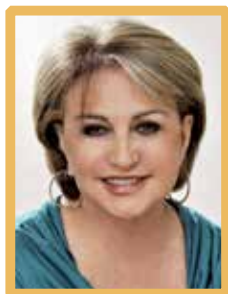
Deputada Elcione Barbalho (PMDB-PA) – procuradora especial da Mulher;

A Resolução nº 10, de 2009, que cria a Procuradoria Especial da Mulher, alterando o Regimento Interno da Câmara dos Deputados, estabelece que o órgão será constituído de uma procuradora especial da Mulher e de três procuradoras adjuntas. Atualmente ocupam os cargos na Câmara Federal: