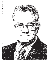
ELISEU RESENDE (PFL/MG)