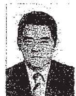
NÍCIAS RIBEIRO (PSDB/PA)