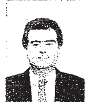
FLÁVIO DERZI (PMDB/MS)