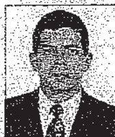
PAULO FEIJÓ (PSDB/RJ)