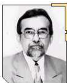
B. Sá PPS/PI