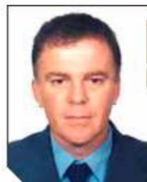
Renato Casagrande PSB/SP