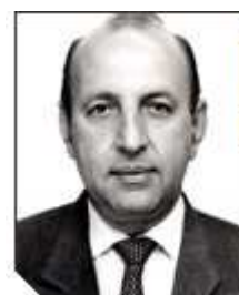
Simão Sessim PP/RJ