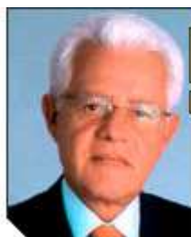
Moreira Franco PMDB/RJ