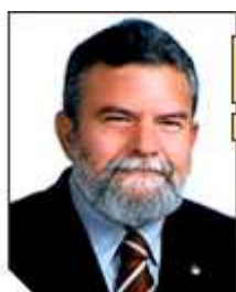
Betinho Rosado PFL/RN