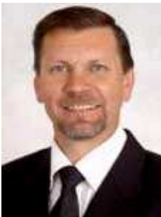
Presidente Afonso Hamm PP/RS