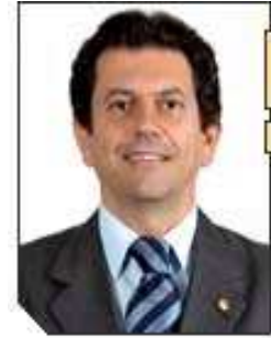
3º Vice-Presidente Otavio Leite PSDB/RJ