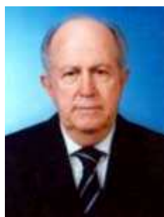
Presidente Albano Franco PSDB/SE