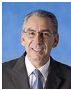
2º Vice-Presidente Silvio Torres PSDB/SP