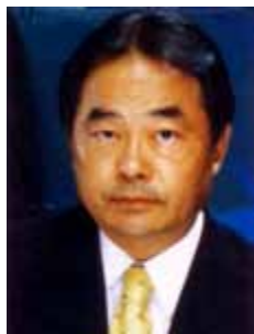
TAKAYAMA PSC - PR