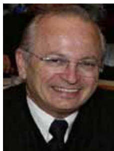
DR. UBIALI PSB - SP

Gabinete 484 Anexo 3 Fone 3215-5484 Fax 3215-2484