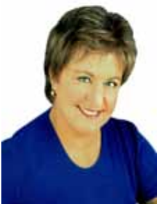
BEL MESQUITA PMDB - PA

Gabinete 739 Anexo 4 Fone 3215-5739 Fax 3215-2739