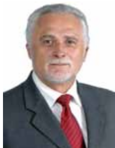
JOSÉ GENOÍNO PT - SP