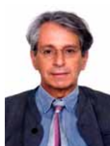
FERNANDO GABEIRA PV - RJ

Gabinete 427 Anexo 4 Fone 3215-5427 Fax 3215-2427