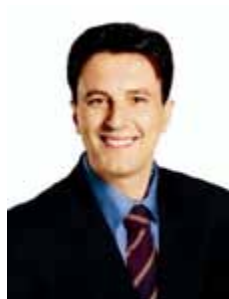
VIGNATTI PT - SC

Gabinete 711 Anexo 4 Fone 3215-5711 Fax 3215-2711