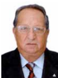
PROFESSOR RUY PAULETTI PSDB - RS

Gabinete 810 Anexo 4 Fone 3215-5810 Fax 3215-2810