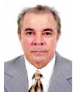
NEUDO CAMPOS PP - RR

Gabinete 452 Anexo 4 Fone 3215-5452 Fax 3215-2452