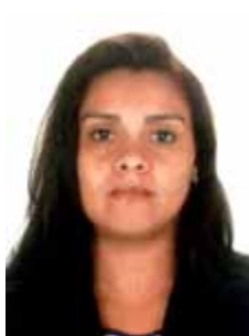
SUELY PR - RJ

Gabinete 812 Anexo 4 Fone 3215-5812 Fax 3215-2812