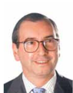
EDUARDO CUNHA PMDB - RJ

Gabinete 540 Anexo 4 Fone 3215-5540 Fax 3215-2540