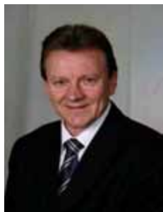
CELSO MALDANER PMDB - SC