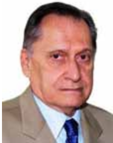
ROBERTO MAGALHÃES DEM - PE