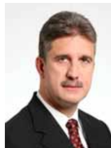
MILTON MONTI PR - SP

Gabinete 638 Anexo 4 Fone 3215-5638 Fax 3215-2638