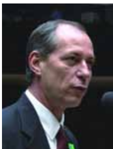
CIRO GOMES PSB - CE

Gabinete 402 Anexo 4 Fone 3215-5402 Fax 3215-2402