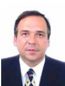
SANDRO MABEL PR - GO

Gabinete 650 Anexo 4 Fone 3215-5650 Fax 3215-2650