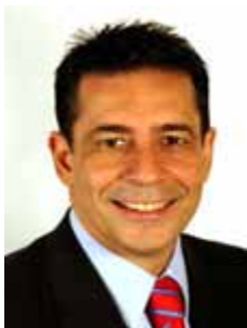
SÉRGIO BARRADAS CARNEIRO PT - BA

dep.sergio barradascarneiro@camara.gov.br