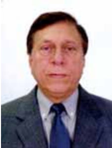
JULIÃO AMIN PDT - MA