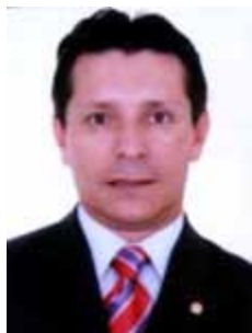
CAPITÃO ASSUMÇÃO PSB - ES