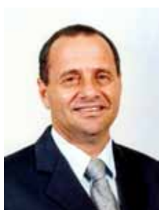
MANATO PDT - ES

Gabinete 562 Anexo 4 Fone 3215-5562 Fax 3215-2562