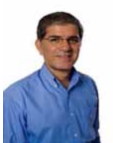
CHICO D'ANGELO PT - RJ

Gabinete 633 Anexo 4 Fone 3215-5633 Fax 3215-2633