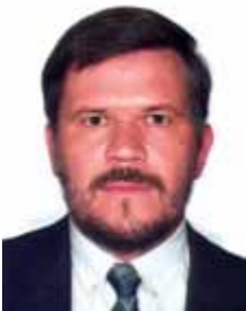
ASSIS DO COUTO PT - PR

Gabinete 410 Anexo 4 Fone 3215-5410 Fax 3215-2410