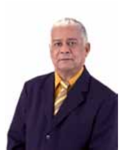
VELOSO PMDB - BA

Gabinete 724 Anexo 4 Fone 3215-5724 Fax 3215-2724