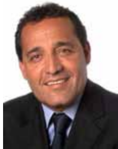
DELEY PSC - RJ

Gabinete 432 Anexo 4 Fone 3215-5432 Fax 3215-2432