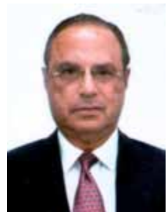
PAULO MALUF PP - SP

Gabinete 903 Anexo 4 Fone 3215-5903 Fax 3215-2903