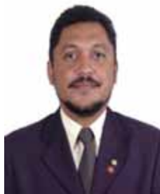
EUDES XAVIER PT - CE

Gabinete 318 Anexo 4 Fone 3215-5318 Fax 3215-2318