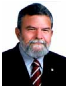
BETINHO ROSADO DEM - RN