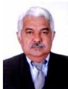
PROFESSOR SETIMO PMDB - MA

Gabinete 734 Anexo 4 Fone 3215-5734 Fax 3215-2734