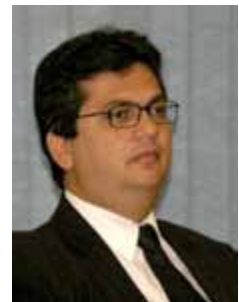
FLÁVIO DINO PCdoB - MA

Gabinete 654 Anexo 4 Fone 3215-5654 Fax 3215-2654