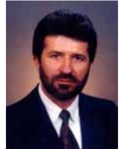
GONZAGA PATRIOTA PSB - PE

Gabinete 430 Anexo 4 Fone 3215-5430 Fax 3215-2430