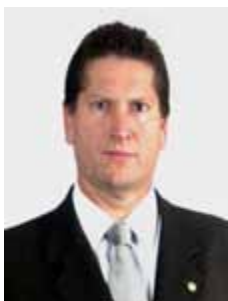
JILMAR TATTO PT - SP

Gabinete 840 Anexo 4 Fone 3215-5840 Fax 3215-2840