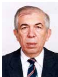
PAES LANDIM PTB - PI

Gabinete 267 Anexo 3 Fone 3215-5267 Fax 3215-2267