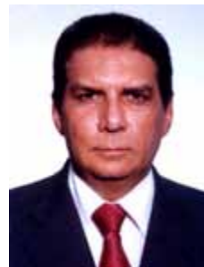
JADER BARBALHO PMDB - PA

Gabinete 752 Anexo 4 Fone 3215-5752 Fax 3215-2752