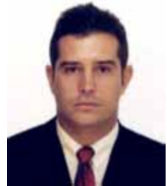
MAURÍCIO QUINTELLA LESSA PR - AL

dep.mauricioquintellalessa@camara.gov.br