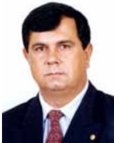
CHICO DA PRINCESA PR - PR

Gabinete 848 Anexo 4 Fone 3215-5848 Fax 3215-2848