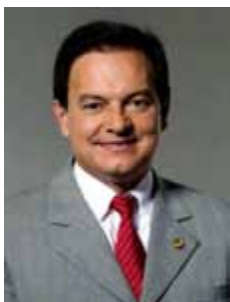
AELTON FREITAS PR - MG

Gabinete 744 Anexo 4 Fone 3215-5744 Fax 3215-2744