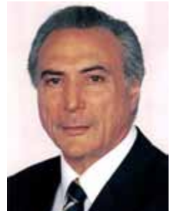
MICHEL TEMER PMDB - SP

Gabinete 508 Anexo 4 Fone 3215-5508 Fax 3215-2508