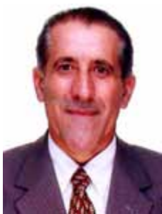
ZONTA PP - SC

Gabinete 741 Anexo 4 Fone 3215-5741 Fax 3215-2741