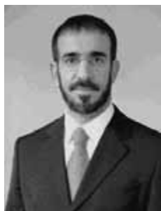
BISPO GÊ TENUTA DEM - SP

Gabinete 558 Anexo 4 Fone 3215-5558 Fax 3215-2558