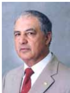
TATICO PTB - GO

Gabinete 910 Anexo 4 Fone 3215-5910 Fax 3215-2910