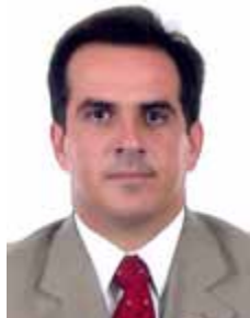
CIRO NOGUEIRA PP - PI

Gabinete 577 Anexo 3 Fone 3215-5577 Fax 3215-2577