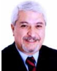
DR. NECHAR PP - SP

Gabinete 445 Anexo 4 Fone 3215-5445 Fax 3215-2445