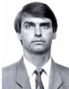
JAIR BOLSONARO PP - RJ

Gabinete 333 Anexo 4 Fone 3215-5333 Fax 3215-2333