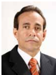
PINTO ITAMARATY PSDB - MA