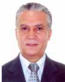
MAGELA PT - DF

Gabinete 352 Anexo 4 Fone 3215-5352 Fax 3215-2352