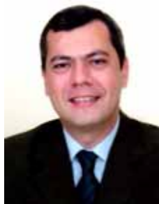
IRAN BARBOSA PT - SE

Gabinete 26 Anexo 2 Fone 3215-8171 Fax 3215-2963