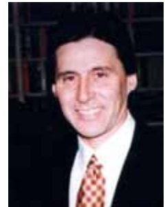
EUNÍCIO OLIVEIRA PMDB - CE

Gabinete 382 Anexo 3 Fone 3215-5382 Fax 3215-2382