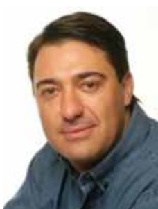
GIACOBO PR - PR

Gabinete 418 Anexo 4 Fone 3215-5418 Fax 3215-2418