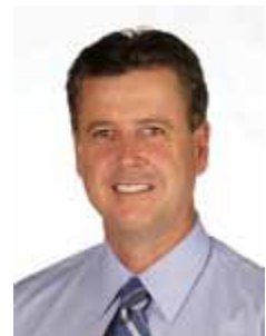
RODRIGO ROLLEMBERG PSB - DF

Gabinete 476 Anexo 3 Fone 3215-5476 Fax 3215-2476