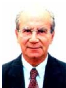
JOFRAN FREJAT PR - DF

Gabinete 717 Anexo 4 Fone 3215-5717 Fax 3215-2717