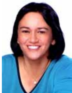
FÁTIMA BEZERRA PT - RN