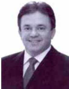
VANDER LOUBET PT - MS