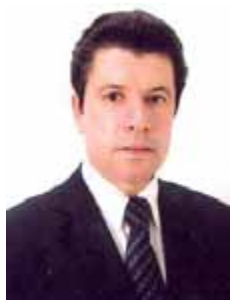
PROFESSOR VICTORIO GALLI PMDB - MT

dep.professorvictoriogalli@camara.gov.br