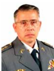
PAES DE LIRA PTC - SP

Gabinete 437 Anexo 4 Fone 3215-5437 Fax 3215-2437