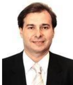
2013 RODRIGO MAIA