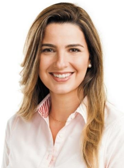
Deputada Clarissa Garotinho ( PR-RJ )

Ao término do Exercício de 2015, ano de crescentes dificuldades econômicas e de complicadas relações institucionais entre os poderes constituídos, esta Comissão de Viação e Transportes da Câmara dos Deputados tem a grande satisfação de apresentar o seu exemplo como Colegiado coeso que, apesar das adversidades conjunturais e diferenças ideológicas, conseguiu, neste ano em que tive a oportunidade e a honra de presidir os trabalhos, imprimir notável ritmo de trabalho em todas as atividades, realizando sessenta e sete reuniões formais no Palácio do Congresso Nacional, sendo 38 reuniões deliberativas, 22 reuniões de audiência pública e mais 7 reuniões de audiência pública promovidas em conjunto com outras comissões desta Casa Legislativa.