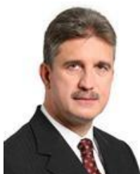
2010 MILTON MONTI