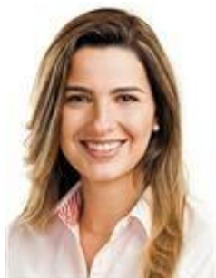
Presidente CLARISSA GAROTINHO PR/RJ