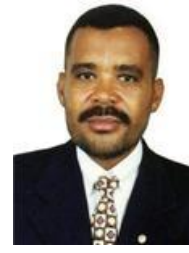
1991 CARLOS SANTANA