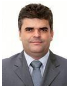
2012 WASHINGTON REIS