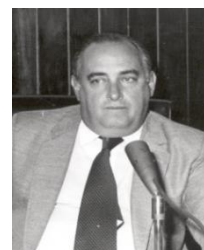
1985 JUAREZ BATISTA