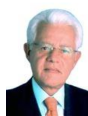
1995 MOREIRA FRANCO