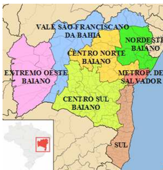
Figura 2 - Mesorregiões da Bahia

A explanação contida nos parágrafos acima permite sustentar a sugestão que segue, a qual se presta a servir de balão-de-ensaio. A função planejadora do Estado (tratada na subseção 2.1) seria significativamente aprimorada se, durante a etapa de elaboração orçamentária, os órgãos fossem instados a apresentar suas demandas orçamentárias com a maior precisão possível. Sugere-se como grau de especificidade mínimo a definição da mesorregião 32 do gasto. Para ilustrar o exemplo tomado nesta subseção e auxiliar na compreensão da idéia, a Figura 2 mostra um mapa contendo as sete mesorregiões da Bahia, de um total de 138 existentes no país.